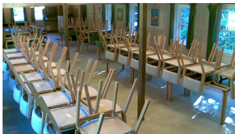
Bordopstilling når hytten forlades. Hvide stole ved de to langborde. Grønne stole ved hvert af de 4 gruppeborde.